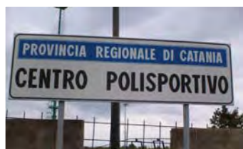
Il Centro polisportivo della Provincia di Catania: piscina olimpionica, piscina per bambini, pista di pattinaggio, campi da tennis, basket, calcio, spogliatoi, foresteria. Oggi, totalmente, abbandonato