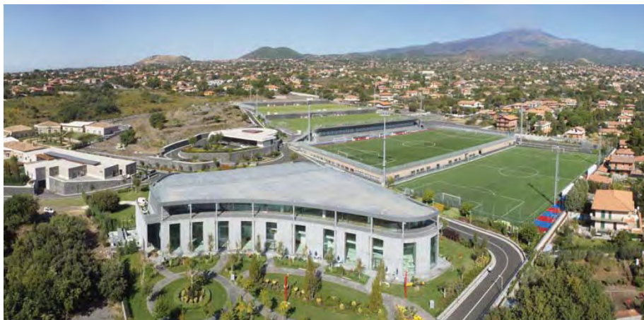
Torre del Grifo Village è una delle strutture sportive private più grandi d'Italia, con oltre 1.500 mq di superficie coperta su 4 livelli, 2 piscine coperte, 4 sale per attività di fitness, Centro Benessere, Sala Congressi, bar, ristorante, Catania Point. La struttura è nata per il Calcio Catania

«Mi piace riportare dati che non riguardano esclusivamente Segea ma l'afflusso, l'operatività ed il lavoro quotidiano a Torre del Grifo Village di tutte le persone coinvolte in un grande progetto: ogni giorno, Calcio Catania, Segea e le aziende fornitrici o dell'indotto portano nel nostro Centro Sportivo circa 300 persone, con un campionario di professionalità estremamente variegato, dal massimo dirigente agli operatori addetti al-