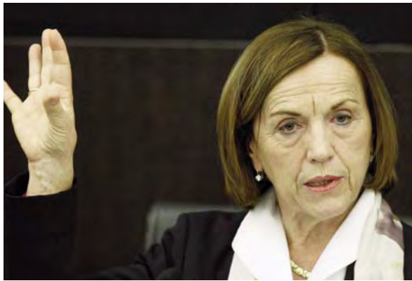
Il ministro del Lavoro Elsa Fornero

La riforma ha introdotto per il contratto a tempo determinato la possibilità, per il primo contratto, purché di durata fino a 12 mesi, di non indicare la causale (c.d. acausale), opzione che avrebbe dovuto portare le aziende ad utilizzare questo contratto al posto del periodo di prova previsto per il tempo indeterminato. La riforma ha però ampliato il periodo di sospensione tra un contratto e l'altro, necessitando pertanto, per richiamare la stessa persona, un periodo minimo di 90 giorni, se il contratto precedente ha avuto una durata superiore a 6 mesi, e 60 giorni di sospensione, se il contratto di lavoro ha avuto una durata infe-